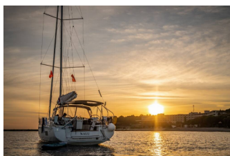
OCEANIS 46.1 - layout 4 CABINS & 2 HEADS